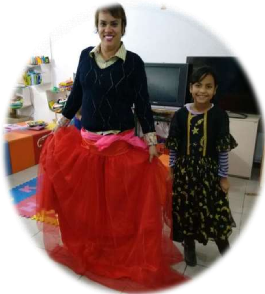
Figura 6 - Professora da Brinquedoteca e aluna em representação

A Brinquedoteca da FMP, enquanto espaço lúdico pedagógico, atende crianças, filhos/as dos alunos/as e professores/as dos cursos de graduação e pós-graduação, Educação de Jovens e Adultos (EJA) e trabalhadores/as que participam das feiras de exposição dentro da instituição, na faixa etária entre três e doze anos.