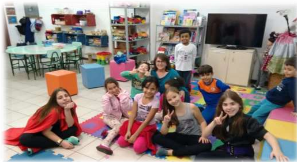
Figura 4 - Crianças em atividades na Brinquedoteca da FMP

Segundo Souza, (1995), o brincar traduz uma necessidade vital para as crianças, pois brincando a criança mergulha na vida, sentindo-a na dimensão de suas possibilidades. Portanto, afirma-se que brincar é essencial a saúde física, emocional e intelectual do ser humano.