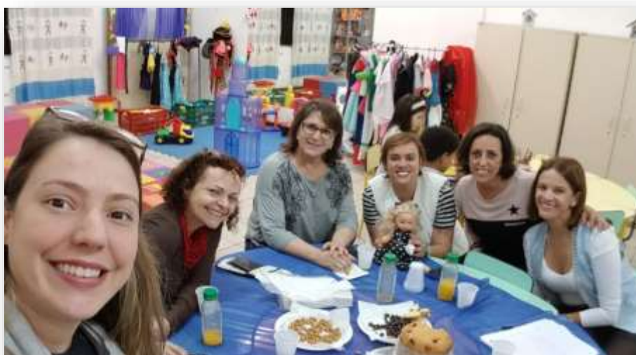
Figura 11 - Reunião de Planejamento das profissionais da Brinquedoteca

A Brinquedoteca do Curso de Pedagogia da FMP tem como objetivo principal oferecer um espaço público, gratuito e de qualidade onde professores/as e estudantes do Curso de Pedagogia possam realizar práticas interdisciplinares e dedicar-se à exploração do brinquedo tendo como foco o desenvolvimento infantil.