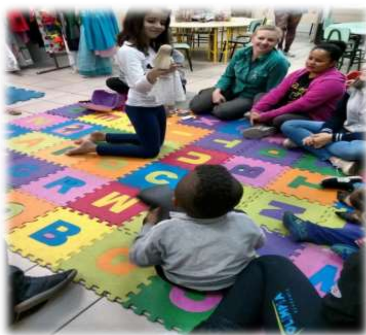
Figura 7 - Desfile de bonecas feito pelas crianças e apresentado para a turma de estudantes da 3ª fase de Pedagogia (disciplina de Didática 2)

As profissionais da brinquedoteca, sempre que necessário, intervêm nas brincadeiras para mediar conflitos, incentivar e valorizar atitudes de respeito, solidariedade, cooperação, amizade, ludicidade, linguagem oral, escrita, criatividade e imaginação. No mesmo sentido, as professoras contribuem e intensificam a valorização das relações familiares em diferentes arranjos e problematizam ações de preconceito e discriminação sobre temas relacionados às diversidades etnicorraciais, de gênero, sexualidade, sociais, econômicas e morais para que as crianças conheçam seus limites e potencialidades em relação a si mesmas e ao outro, enquanto sujeitos de direitos.