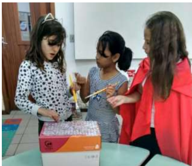
Figura 12 - Crianças ajudando a confeccionar a caixa-surpresa

Enquanto os objetivos específicos buscam (1) possibilitar as crianças, filhos/as de estudantes, professores/as e trabalhadores que atuam na instituição momentos de brincadeira, realizando atividades lúdicas, desenvolvendo a expressão artística, transformando e descobrindo novos significados na interação com outras crianças de diferentes idades, (2) contribuir para a conceituação de jogo, brinquedo, brincadeira e sua importância na educação; (3) formar profissionais que valorizem o lúdico; (4) desenvolver pesquisas que apontem a relevância dos jogos, brinquedos e brincadeiras para a educação; (5) oferecer informações, organizar cursos e divulgar experiências e (6) estimular ações lúdicas entre os docentes e os alunos do curso no que tange à construção do conhecimento em matemática, alfabetização, metodologias do ensino, arte e literatura entre outras.