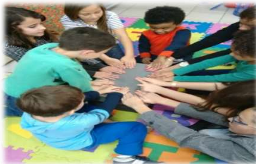
Figura 10 - Brincadeira da Caixa Surpresa

Assim, a brinquedoteca é um espaço de fomento ao processo educativo coletivo que contempla a comunidade de acadêmico/as, professores/as e profissionais da educação, de forma representativa, significativa e ludopedagógica.