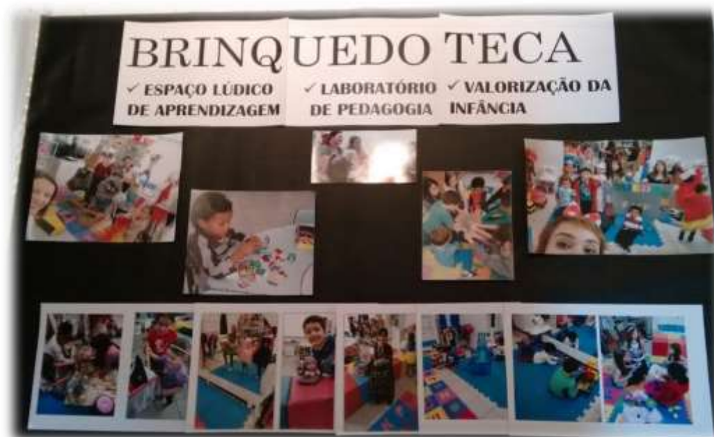
Figura 5 - Mural da entrada da Brinquedoteca FMP

Portanto, é com o propósito de integração dos objetivos sociais, de ensino, pesquisa e extensão que se apresenta este projeto. Brinquedoteca faz parte de um projeto de extensão universitária da FMP com o compromisso de valorização da infância em um espaço pedagógico que oferece a estudantes e professores do curso de Pedagogia produção de conhecimento científico. O objetivo é propiciar um espaço onde professores e estudantes podem realizar práticas interdisciplinares e dedicar-se a exploração do brinquedo tendo como foco o desenvolvimento infantil.